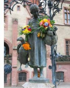
Gänseliesel (Goose Lizzy)